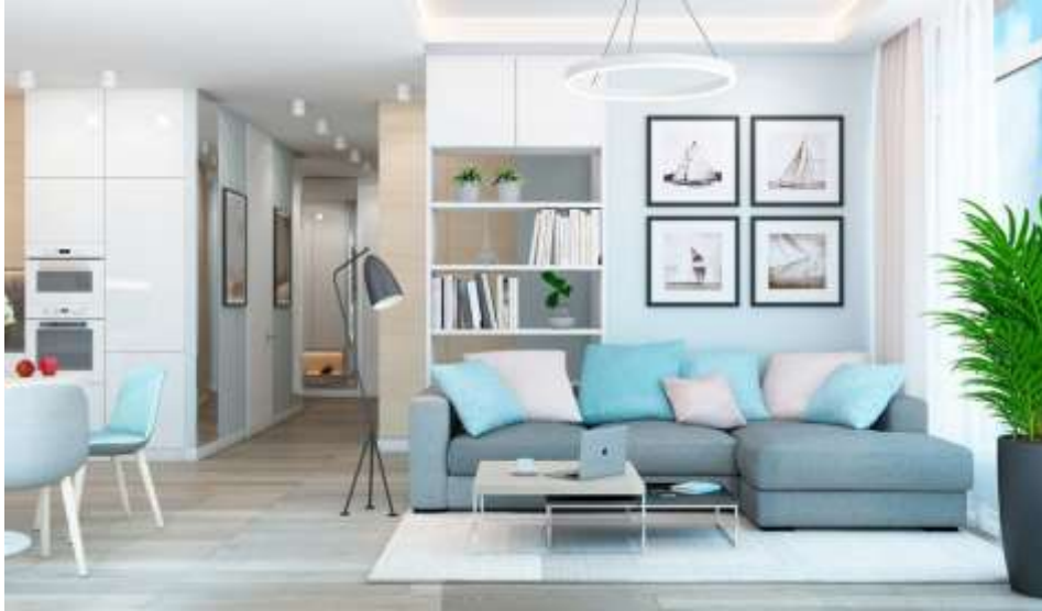
14-rasm. Interyerda ishki makonni tashkil qilish