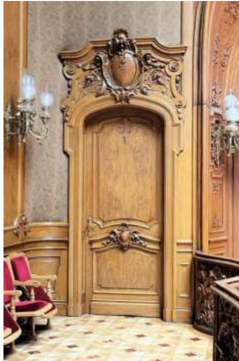
16-rasm. Eshik bezaklari

Tasviriy plastika san'ati o'simlik, hayvonot dunyosining tabiiy shakllari va ijtimoiy hayot manzaralari asosida haykaltaroshlik reliefi sifatida yaratilgan. Rasmlarda har qanday umumlashtirish va konventsiya darajasi qo'llanilishi mumkin. Bejirim relyef haykaltaroshlik bilan sintezning fizik asoslari bo'lib xizmat qiladi. Bitta materialdagi plastik ishlanmalar panjara shaklining yaxlitligini yaratadi. Relyef asosi uchun turli materiallardan foydalanish uning dekorativligini tavsiflaydi. Ushbu uslub tekislikni emas, balki relyefning shaklini, uning mustaqilligini ta'minlaydi.