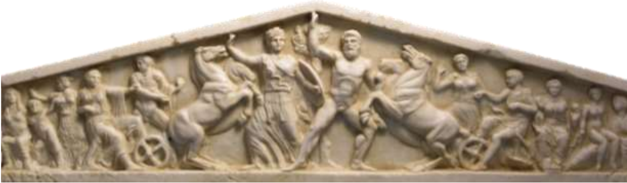
10-rasm. Afina parfenonining frizi. Barelyef

Klassizm san'ati rivojlanib borgan sari haykal va relyef pannolarining hajmli plastik ifodasida moslashuvi bilan bog'liq o'zgarishlar vujudga kela boshladi. Agar haykal hajmining uchdan bir qismi devorga tegishli bo'lsa, u holda relyef panno, aksincha, fonga nisbatan tobora ko'proq chiqib ketsa dumaloq haykal sifatida gavdalanadi. Natijada, haykalning hajmiy kontrastlari tekislanadi va haykaltaroshlik plastikligi deyarli "gilam" sirtini hosil qiladi. Tekisliklar va hajmlarning kontrasti o'rnini bezak bilan to'yingan sirtlar, shu jumladan relyef va silliq, ramkasiz yuzalar kontrasti egallaydi. Haykaltaroshlik relyefining ikkinchi muhim turi friz relyefi 38 dir 39 (10-rasm). Bu zalning devorlari perimetrini o'rab