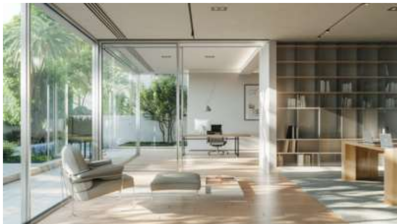
13-rasm. Zamonaviy rayonlashtirish yechimlari. Uy-joy dizaynidagi shisha va sunta

Ichki makonning bo'linishini qabul qilish usuli 43 (14-rasm). Bunday holda, hajmli haykaltaroshlik ishlari muayyan faoliyat yoki harakat sohalarini ta'kidlash uchun ishlatiladi.