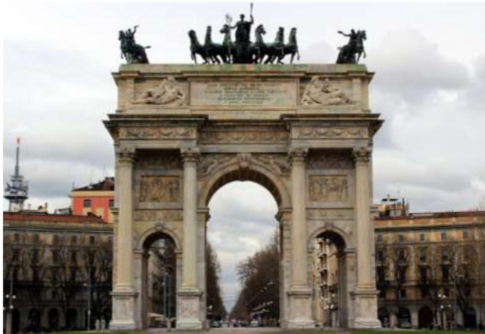
6-rasm. Arco Della Pace. Ark. Milan, Italiya

Ushbu ajoyib dekorativ haykaltaroshlik asarlari ba'zi muhim binolarni loyihalashda asosiy ifoda vositalaridan birini tashkil etadi. Haykaltaroshlik va qurilish me'morchiligi sintezining ajoyib namunasi bo'lgan bu asarlar shahar ansambllarida sezilarli ustunlik xususiyatiga aylandi.