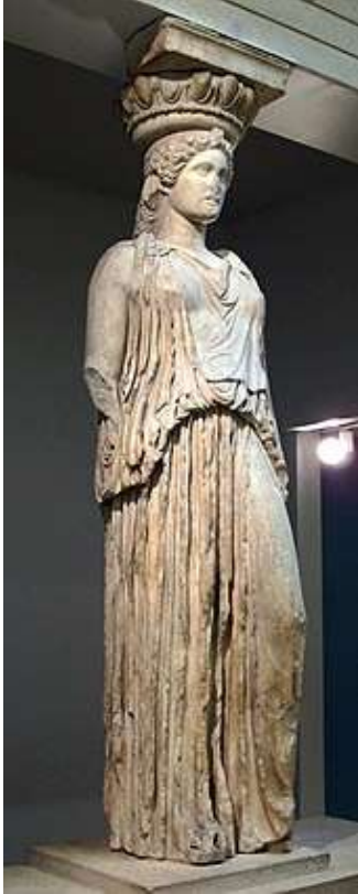
2-rasm. Afina akropolidagi Erechteion portikasidan karyatid figurasi. Britaniya muzeyi, London