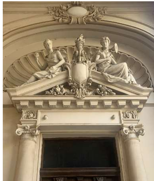
5-rasm. Ruminiya tarixi milliy muzeyiga frontonidagi haykallar. Buxarest, Ruminiya