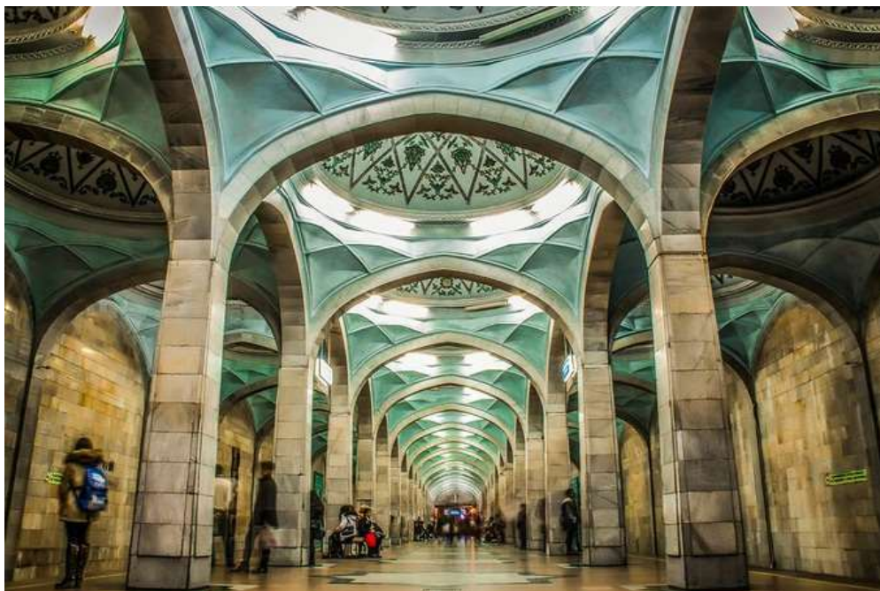
15-rasm. Metro bekatining ichki bezatilishi. A.Navoiy metro bekati, Toshkent

Ichki makonda ma'noli yo'nalish uchun alohida ahamiyatga ega bo'lgan hajm yoki tekislikni ta'kidlash texnikasi 44 (15-rasm). Bu uslub devorni yana bo'laklarga ajratish va unga kenglik berish maqsadida turli xil dekorativ bezaklardan foydalanadi. Syujetli yoki dekorativ-bezakli mazmunga ega bo'lgan monumental kompozitsiya urg'u shaklining ma'nosini aniqlashtirishga yordam beradi. Dekorativ bezak ishlarida plastik elementlar kichik hajmli yuqori elementlar sifatida sun'iy ravishda yaratiladi. Relyefning chuqurligi xonaning shkalasi bilan belgilanadi. Ifoda shakliga ko'ra bunday plastika mavhum yoki obrazli bo'lishi mumkin. Abstrakt xarakter me'moriy va konstruktiv shaklga xosdir va ular o'z navbatida karniz, profil va platband 45 shaklida qo'llaniladi 46 (16-rasm).