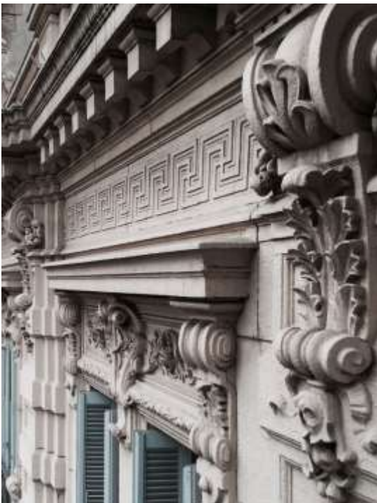
4-rasm. Barokko uslubidagi Petrov Pilasterlari. Sankt Peterburg, Rossiya