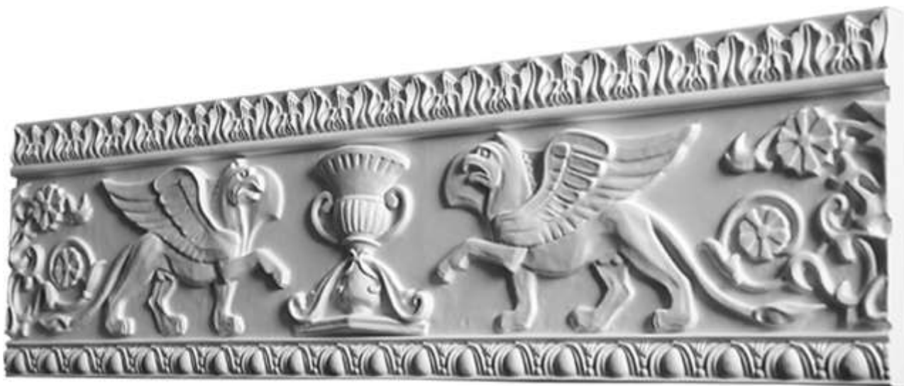
9-rasm. Dekorativ panno badiiy yechimdagi ushbu

Relyef pannolarni devor yoki shift tekisligiga alohida joylashtirish erkin yuzalarni to'ldirish uchun qulay uslublardan biriga aylanib ulgurdi. Umumiy