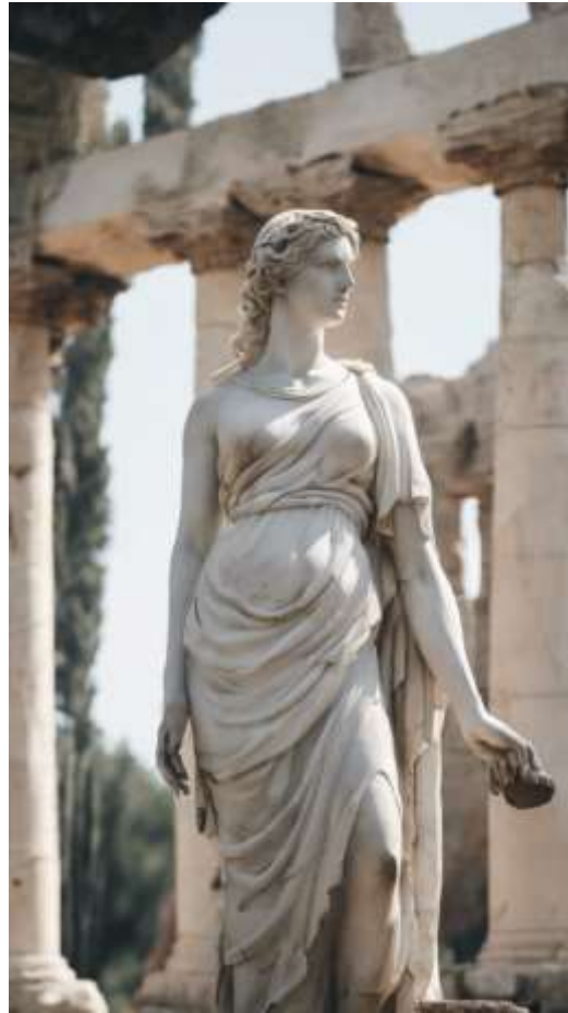
1-rasm. Qadimgi xarobalar orasida g'urur bilan turgan yunon ma'budasining oq marmar haykali

nafaqat ularning tuzilishi bilan tasdiqlanadi, balki haykaltaroshlik plastikligi orqali ham aniqlanadi. Haykallar o'z miqdorda, ko'pincha pedimentning uchta burchagini aks ettiruvchi toj figuralari sifatida ishlatiladi. Binolarning fasadlarida haykallar ustunlar orasiga yoki maxsus bo'shliqlarga o'rnatiladi. Ularning plastik shakldagi namunalari devorning silliq yuzasiga qarama-qarshi holatda bo'laqdi. Old ayvonning haykallar guruhlarini yoki zinapoyaning ikkala tomoniga o'rnatilgan haykallar "qanotlar" rolini o'ynaydi. Ushbu usullarning barchasi struktura hajmining markaziy o'qini belgilash uchun ishlatiladi.