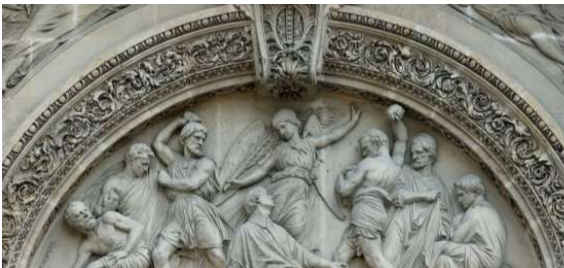
8-rasm. Haykaltaroshlik relyefi

Erkin va hamohang dekorativ haykallar, karyatidlar va germ-karyatidlar "dumaloq" shaklning umumiy xususiyatiga ega bo'lgan dekorativ plastikani ifodalaydi, bu esa devorlar tekisligida ma'lum bir mustaqillikni ta'minlaydi. Plastikaning bu xarakterli ko'rinishlari uni fon bilan kompozitsion va mexanik jihatdan bog'langan u yoki bu darajada qavariq plastik shakl bo'lgan haykaltaroshlik relyefi 36 dan tubdan ajralib turadi (8-rasm).